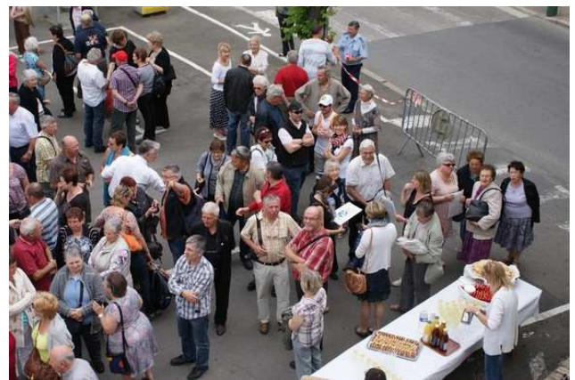
Une vue partielle de la réception offerte par la municipalité du Bugue à la délégation de Marckolsheim.

Du 14 au 17 mai 2015, une centaine de Marckolsheimois s'est déplacée au Bugue dans le Périgord, pour un des nombreux voyages à destination de cette commune jumelée avec la nôtre depuis le 3 mai 1986. La première phrase de l'acte de jumelage établi ce jour là rappelle que « De septembre 1939 à octobre 1940, les populations de Marckolsheim et du Bugue, vivant côte à côte, confrontées ensemble aux funestes conséquences de la guerre, ont appris à se connaître et à s'estimer mutuellement ». Dans ce groupe figuraient plusieurs membres de MLM, parmi lesquels quatre membres du comité. Ces derniers ont offert à M. Montoriol, maire du Bugue au nom de MLM et en témoignage de l'amitié qui, unit les deux communes, un ensemble complet de nos annuaires La Mémoire du Loup / s'Wolfsblattel , à charge pour lui de les remettre à la bibliothèque municipale du Bugue.