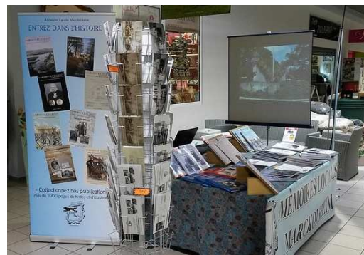
Boutique MLM dans la galerie du magasin Super U (Photo R. Baumgarten).