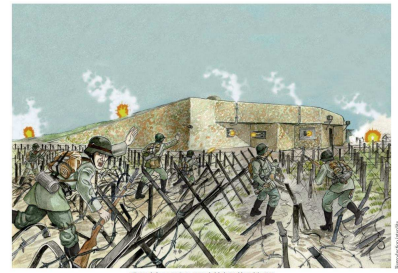
Attaque de la casemate 35/3 Marckolsheim Sud le 16 Juin 1940 Illustration réalisée par Christophe Carmona pour Mémoires Locales Marckolsheim - 70 e anniversaire de la Libération de 1945 - Second usage autorisé

La deuxième fois, ce fut pour la réalisation d'un autre dessin original (reproduction ci-contre), reproduisant l'attaque de la casemate 35/3 « Marckolsheim Sud » par les troupes allemandes. Ce dessin a été utilisé pour la couverture du numéro hors-série de La Mémoire du Loup , « Numéro spécial Seconde Guerre Mondiale », paru début fin janvier 2015 à l'occasion du 70 e anniversaire de la Libération de 1945. Un tiré à part de ce dessin a également été imprimé sur un papier de qualité en format A3, dont il reste d'ailleurs quelques exemplaires à la vente.