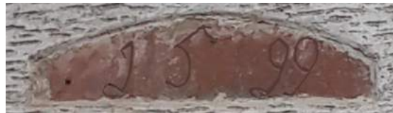
Le linteau de porte de la maison Witz disparue en juin 1940 (la date a été ici surlignée en rouge).